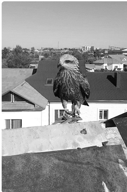
Сокол на крыше дома

Наша газета, Костанайский региональный портал, 1 oktober 2018