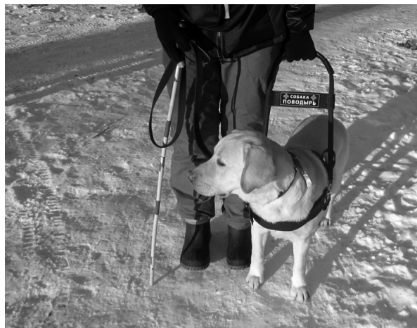
Собака-поводырь в работе

“В последнюю среду апреля 5 отмечается Международный день собак-поводырей. К этой дате мы подготовили запуск проекта «Мы рады собакам-поводырям». Инициатива нужна для того, чтобы 10 незрячие люди с собаками-поводырями спокойно посещали общественные места – магазины, аптеки, кафе, театры – и встречали там дружелюбное отношение к себе и 15 своим четвероногим помощникам.